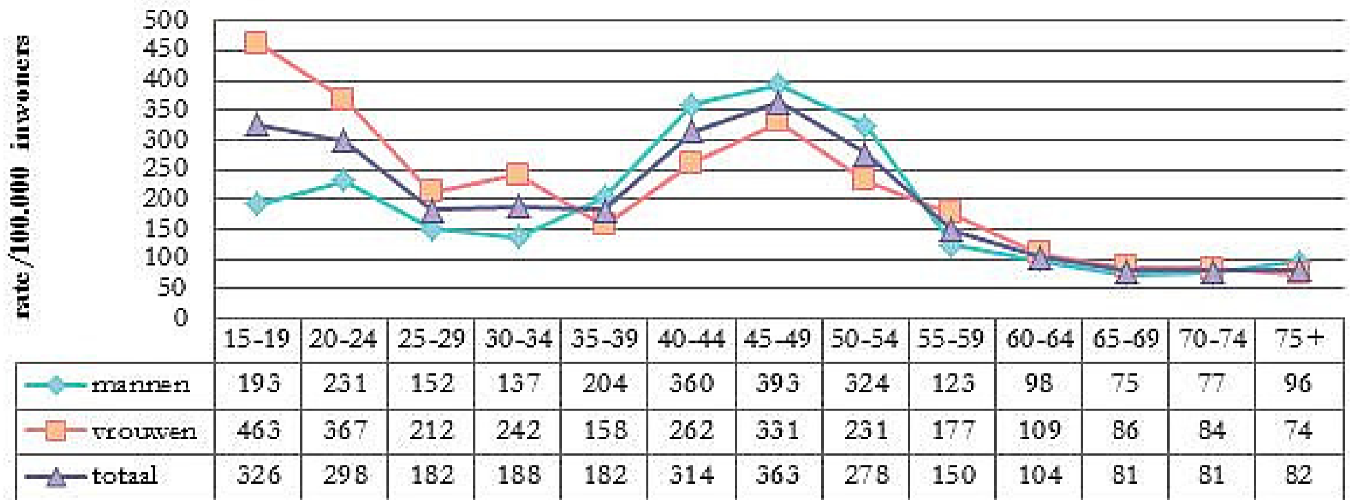
Person-based rates, Groot Gent, 2014, volgens leeftijd en geslacht