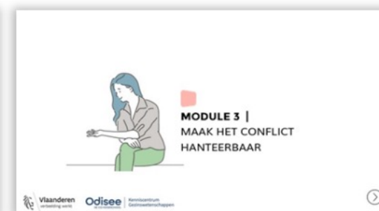
Module 3. Maak het conflict hanteerbaar.