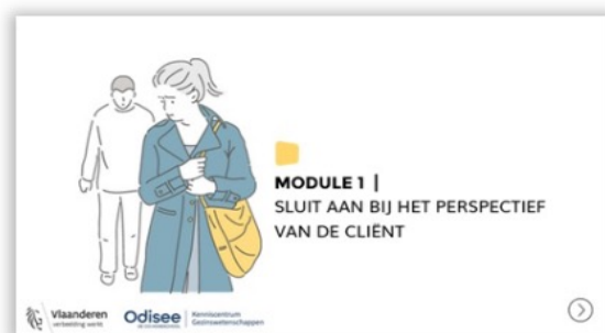
Module 1. Sluit aan bij het perspectief van de cliënt.