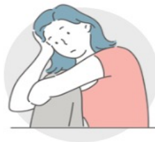
SOCIAAL & INNERLIJK CONFLICT