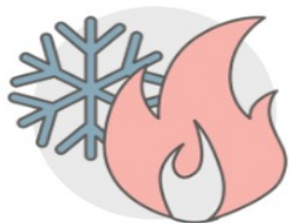
WARM & KOUD CONFLICT