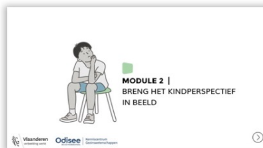
Module 2. Breng het kindperspectief in beeld.